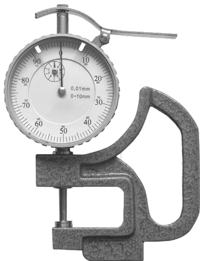
Hloubka třmenu: 30 mm